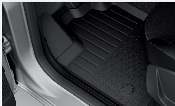
Hattyúnyakas vonóhorog, gumiszőnyeg